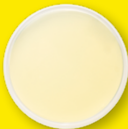
Бактериальный посев с ворса нового салонного фильтра