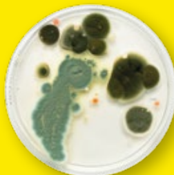
Бактериальный посев с ворса очищенного салонного фильтра